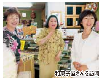
和菓子屋さんを訪問