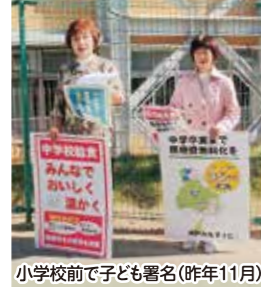
小学校前で子ども署名(昨年11月)