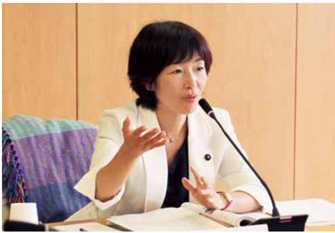
兵庫県議会議員 きだ 結