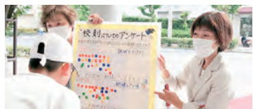
「校則をどう思いますか」と中学生にアンケート(右から、きだ、松本市議)

「下着や靴下の色は白」「ツーブロック禁止」などの校則が社会問題となりました。生徒の人権に関わる問題であり、県立高校、市立中学校などでも見直しが始まっています。各学校で教職員・生徒・保護者が話し合って改善をすすめることが大切です。