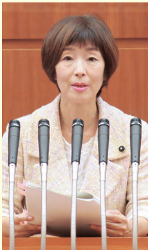
9月30日県議会本会議