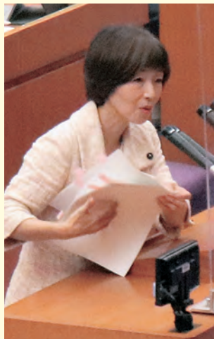
9月30日県議会本会議

市民と共産党議員の取り組みで、この間、駅で「痴漢は犯罪」とのアナウンスなど痴漢対策が前進。