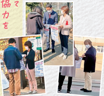
区内小学校前で署名を呼びかけ