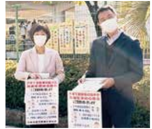
保育所・学校前で子育て署名のお願い